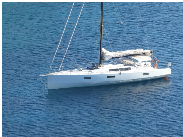
Anse de Grammata à Syros