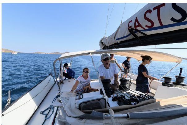
Départ de Mykonos